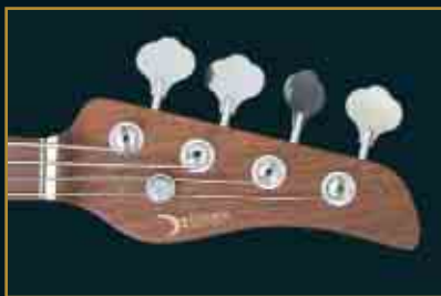
TREVOR BOLDER / URIAH HEEP ENDORSER